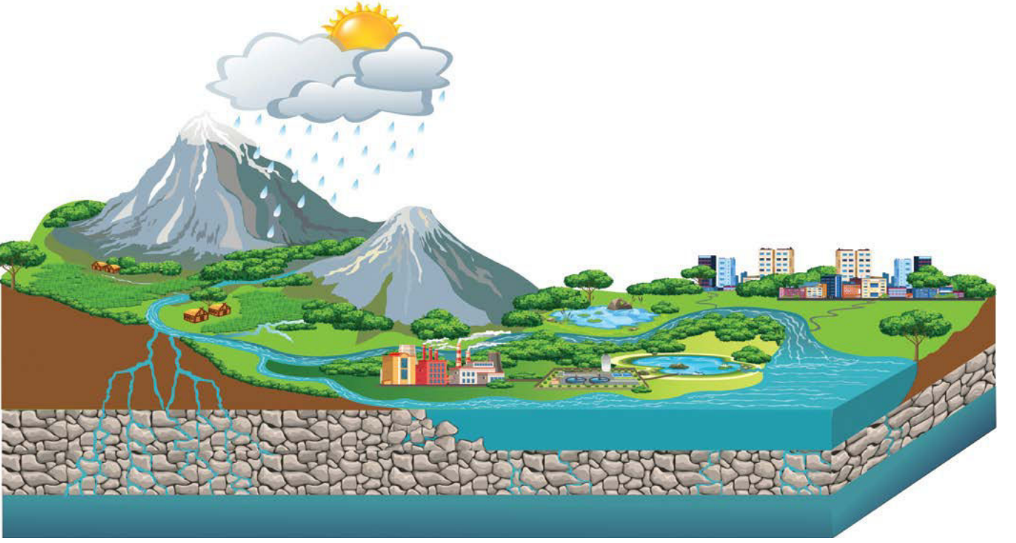
आकृती 3 कोणत्या परिभाषित भौगोलिक सीमेमध्ये जल संस्थांचे विशिष्ट प्रतिनिधित्व आणि त्यांचे परस्पर संबंध

त्यासाठी प्राधान्याच्या आधारे पाण्याचे अंदाजपत्रक ठरवता येणे गरजेचे आहे. cGanga ने Arth गंगा फ्रेमवर्क वर नुकत्याच प्रकाशित केलेल्या अहवालामध्ये यासंदर्भात सविस्तर मांडणी केली आहे. आता माहित नसलेल्या आणि