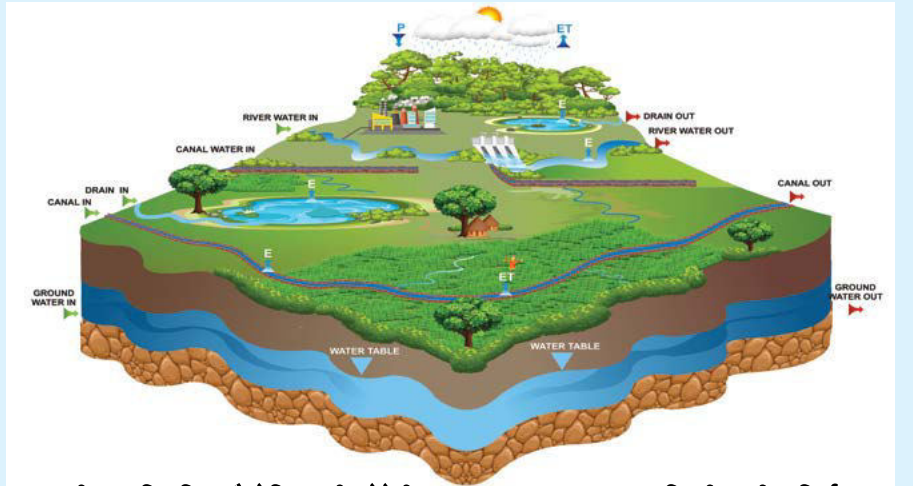
आकृती 4 परिभाषित भौगोलिक सीमारेषेतील पाण्याच्या प्रवाहाच्या आणि झीपतडी बहिर्वाहाच्या विविध स्रोतांचे चित्ररूप सादरीकरण

पाण्याची उपलब्धता हा निकष असावा का? दैनंदिन वापरल्या जाणाऱ्या पाण्याचे प्रमाण ही पाण्याची वास्तविक मागणी मानली पाहिजे की पाण्याचे प्रमाण जे स्थानिक चक्राच्या बाहेर जाते त्याला वास्तविक मागणी मानली जाईल?