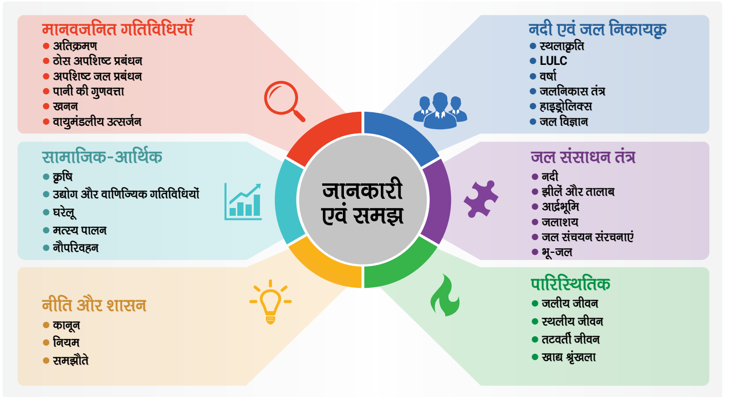
आकृती 2 स्थानिक जल साठ्याच्या संवर्धन आणि विकासाकरिता लागणाऱ्या माहितीचे विविध प्रकार

cGanga हे काम पुढे नेण्याचा प्रयत्न करत आहे. आकृती 2 मध्ये, स्थानिक स्तरावर नद्यांच्या संवर्धनाच्या नियोजनासाठी आवश्यक असलेली विविध प्रकारची माहिती दर्शविण्याचा प्रयत्न केला गेला आहे, मात्र आवश्यक माहितीचे प्रमाण आणि प्रकार स्थानिक परिस्थितीवर अवलंबून असतात.